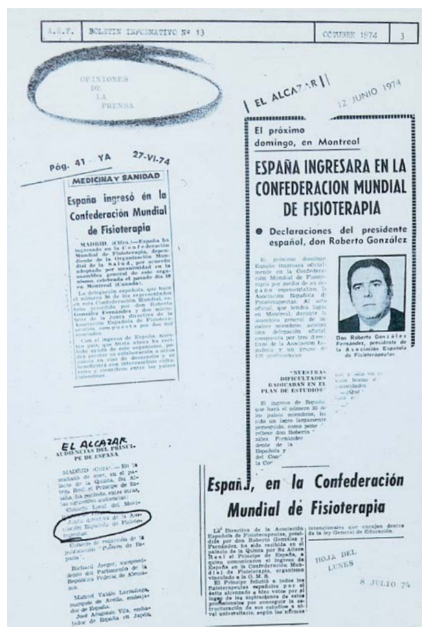
Fig. 4. Noticias de prensa referentes al ingreso de España, a través de la Asociación Española de Fisioterapeutas (AEF) en la Confederación Mundial por la Fisioterapia (WCPT), publicadas en el Boletín Informativo n.º 13 de la AEF

En la formación posgraduada del ayudante en Fisioterapia se incluyeron diferentes cursos como: