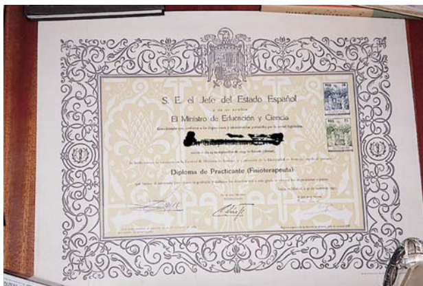
Fig. 1. Uno de los diplomas expedido por el Ministerio de Educación y Ciencia a aquellos que habiéndose formado como practicantes se les había convalidado el título de ayudante en Fisioterapia en 1963, con posterior cambio de denominación en 1970-1971.

La Fisioterapia en España durante los siglos XIX y XX hasta la integración en escuelas universitarias de Fisioterapia