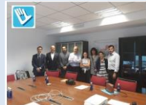
El Director General y Subdirector General de Recursos Humanos del Servicio Murciano de Salud se reúnen con los miembros del Colegio Oficial de Fisioterapeutas de Murcia (CoFiRM) y el Colegio Oficial de Fisioterapeutas de la Región de Murcia, con el fin de establecer un convenio de colaboración y cooperación con el Colegio Profesional de Fisioterapeutas de la Región de Murcia COFIRMUR.